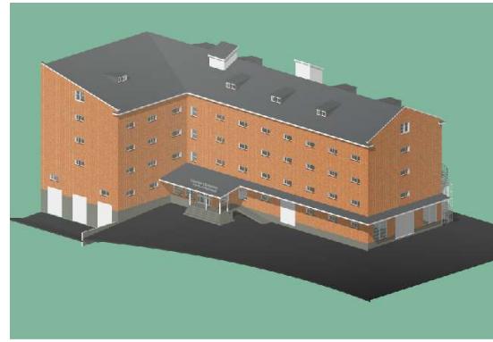
KESÄ 2011 ?