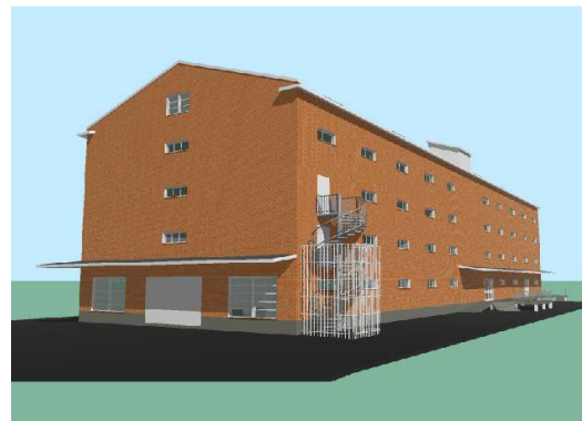
KESÄ 2011 ?